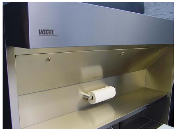
Porta Rollos de toallas de papel