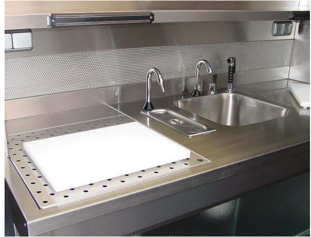
Superficie de trabajo