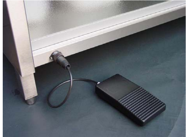
Pedal dispensación de formol

Válvulas accionadas por pedales, para la dispensación de agua caliente y fría. Ubicados convenientemente a voluntad del usuario para el fácil alcance de los dos operadores.