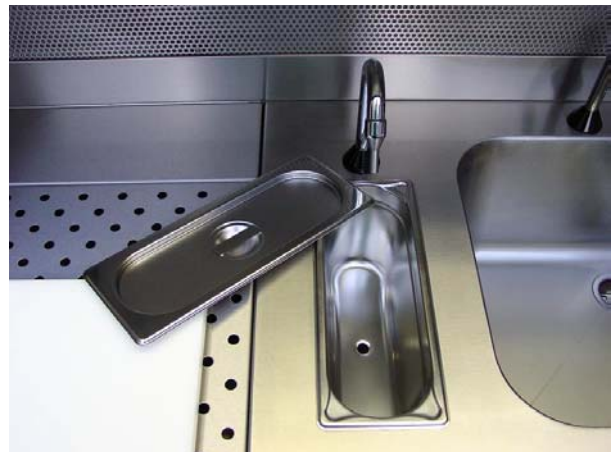
Pileta y dispensador de formol