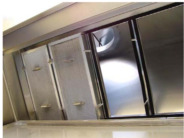
Panel de cajetines de filtros