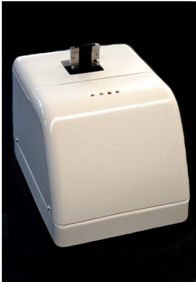
Impresora de portaobjetos SSP-2008